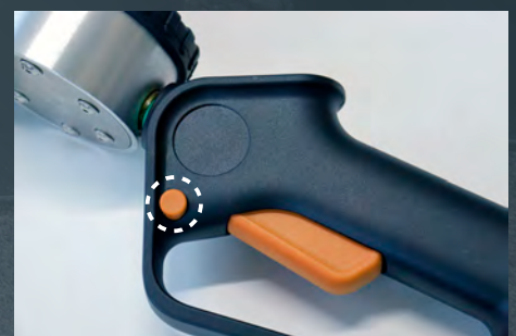
注油レバーのロック機能付き