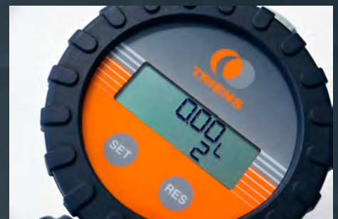
数字が大きく見やすい